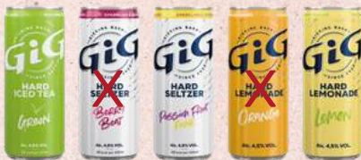
GiG Hard Stelzer (5% alcohol) €4,95

In de smaken: Iced Tea Green, Lemonade Lemon en Passionfruit Funk