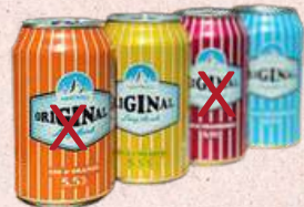
Hartwall (5,5% alcohol) €8,95

In de smaken: Iced Tea Green, Lemonade Lemon en Passionfruit Funk